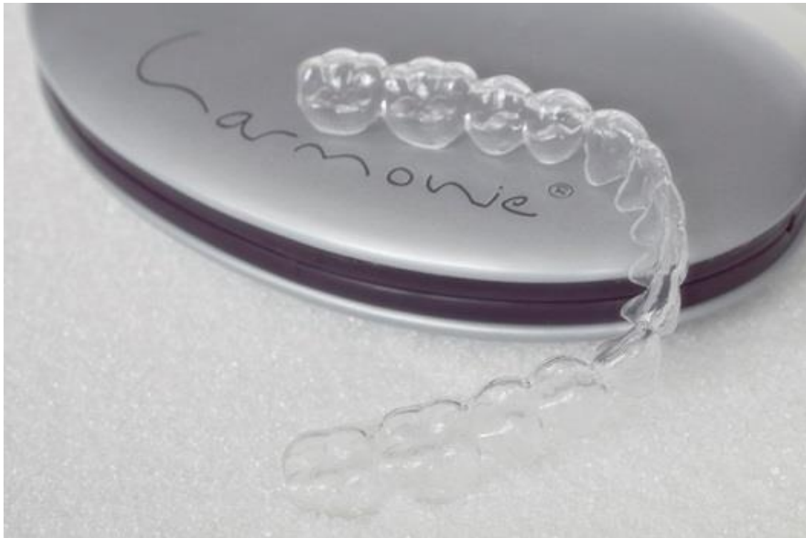
Bildunterschrift_Bild 2: HarmonieSchiene von Orthos – das Original mit der schicken Dose

Lächeln und – die Sonne ging auf: Die Filmdiva wirkte um Jahre jünger und nahm ihr Gegenüber sofort gefangen.