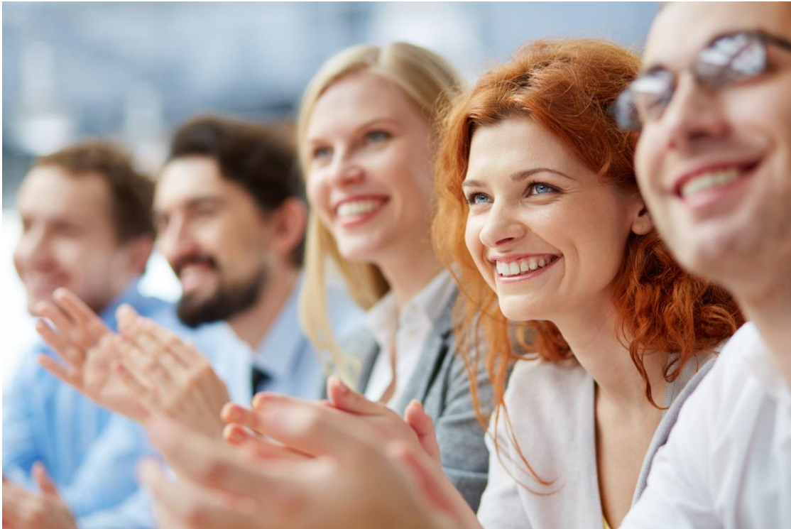
Bildunterschrift_Bild 5: Fachlabor und Zahnärzte arbeiten eng zusammen