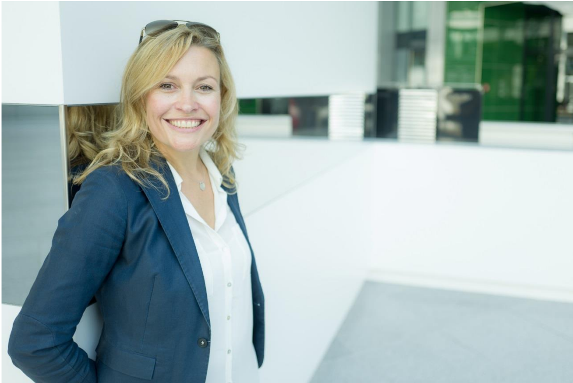
Bildunterschrift_Bild 3: Selbstbewusster durch schöne und gerade Zähne